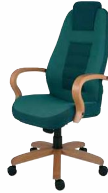
110 STRIPO 5315