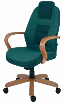
110 STRIPO 5215