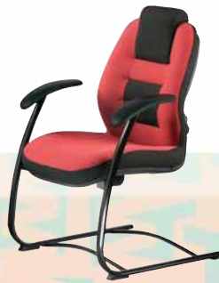
110 STRIPO 5000