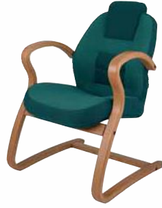
110 STRIPO 5115