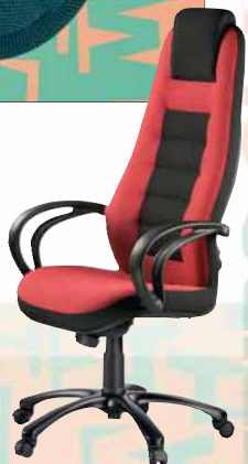
110 STRIPO 5420