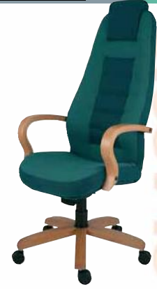
110 STRIPO 5415