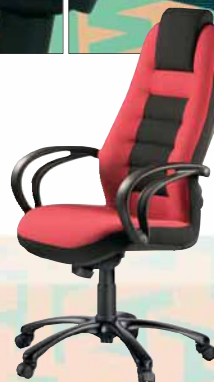
110 STRIPO 5320