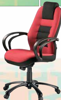
110 STRIPO 5220